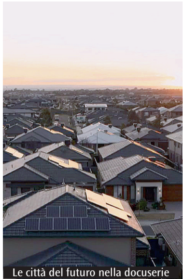
Le città del futuro nella docuserie

Quanto sono importanti le città per la salute del nostro pianeta? Che ruolo hanno e che potenziale possono offrire per affrontare al meglio la crisi climatica nella quale ormai viviamo? A queste delicate domande risponde una dettagliata e coinvolgente docuserie disponibile su Raiplay dal titolo Le città del futuro , prodotta da Italian International Film e Point Nemo in collaborazione con Rai Documentari e Contenuti Digitali e Transmediali. Le città, ci viene subito spiegato, occupano una parte molto piccola della superficie mondiale: tra il 2 e il 3%, ma sono responsabili di più del 70% delle emissioni globali. Ricoprono un doppio ruolo, dunque: uno attivo e uno passivo rispetto al clima. Il primo è relativo all'emissione dei gas serra; il secondo alla profonda sofferenza che i centri urbani vivono in relazione ai cambiamenti climatici. Le città rappresentano il problema e insieme la soluzione a questa