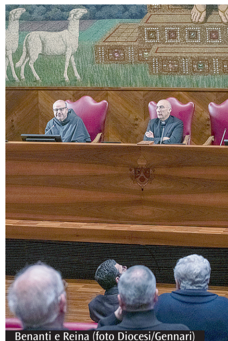
Benanti e Reina

Il saluto del cardinale De Donatis ai sacerdoti e ai fedeli della diocesi al termine della Messa per le ordinazioni. Il dono del Consiglio episcopale Nella basilica di San Pietro undici nuovi presbiteri