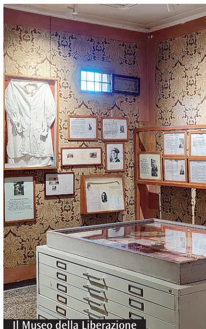
Il Museo della Liberazione