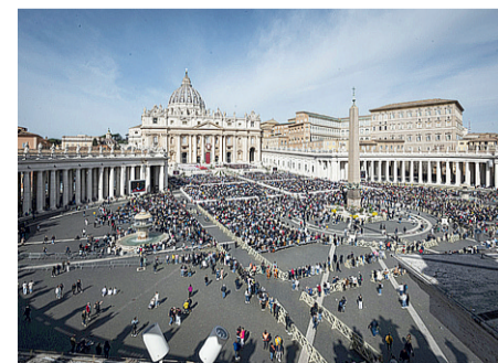
Mancano pochi mesi all'inizio dell'anno giubilare, che avrà per tema «Pellegrini di Speranza»

famosissima opera di Georg Friedrich Händel «Messiah», che sarà eseguita dall'ensemble fiorentina dei «Musici del Gran Principe», diretta dal giovane maestro Samuele Lastrucci. Il Messiah è un oratorio in lingua inglese, composto nel 1741 da Händel, con un testo scritturale elaborato da Charles Jennens. L'ingresso alla rappresentazione è libero e gratuito fino a esaurimento posti. In vista del Giubileo, inoltre, alcuni luoghi della città cambieranno il loro volto tradizionale, da piazza Pia a piazza di Porta San Giovanni, che sono attualmente interessate da lavori di riqualificazione. Il sindaco di Roma