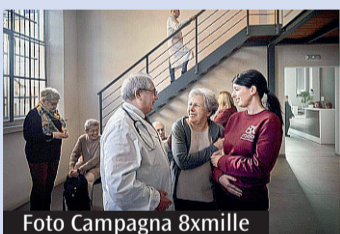
Foto Campagna 8xmille

Sul sito 8xmille.it sono indicate nel dettaglio le modalità per la firma, tenendo presente le diverse opzioni che hanno i contribuenti in sede di dichiarazione dei redditi. Il Modello 730 è riservato a chi, oltre ai redditi di pensione, di lavoro dipendente o assimilati, possiede altri redditi da dichiarare e/o oneri detraibili/deducibili e non ha la partita Iva.