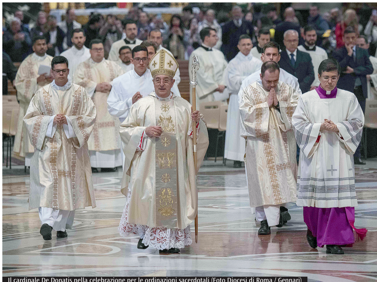
Il cardinale De Donatis nella celebrazione per le ordinazioni sacerdotali